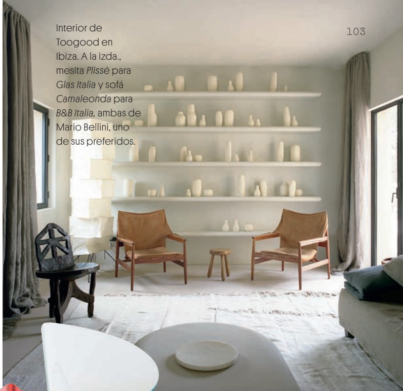
Interior de Toogood en Ibiza. A la izda., mesita Plissé para Glas Italia y sofá Camaleonda para B&B Italia , ambas de Mario Bellini, uno de sus preferidos.