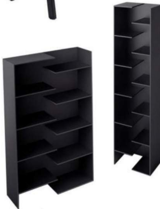
Étagères Shelves Step Desalto