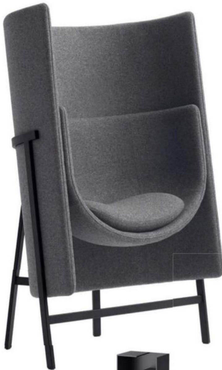
Fauteuil Armchair Kite Stellar Works — Chaise Chair No2 Recycle Fritz Hansen

Architect, designer and director of the studio Nendo since 2002, Oki Sato works with the biggest international furniture brands. Inspired by Japanese minimalism, he reinterprets it through a contemporary prism, often adding a poetic touch, as in his rail-like Frame shelf-mirrors for Stellar Works. His lyrical sense was also evident in Ame Nochi Hana ("rain flowers"), a dreamlike installation at the Bon Marché department store earlier in 2020. Recent collaborations: Coca-Cola, Desalto, Fritz Hansen, Kakao Corp, Minotti, Seki Furniture, Stellar Works, The Hour Glass.