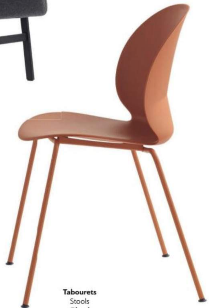
Tabourets Stools Blend Stellar Works