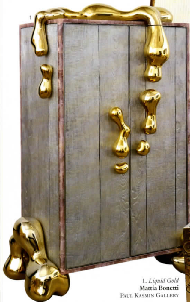
1. Liquid Gold Mattia Bonetti PAUL KASMIN GALLERY