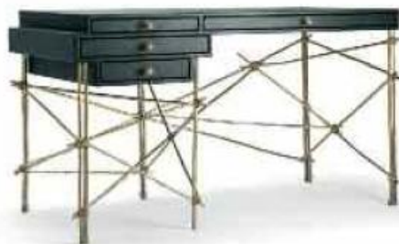
Pad London: Studio Gilthero, Les French Desk, 2012.