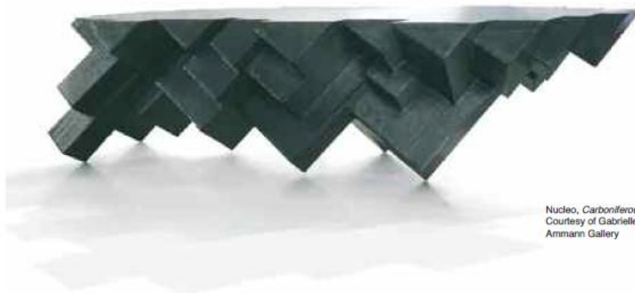
Nucleo, Carboniferous , 2011.