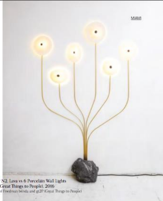
Less CPP N2, Lava vs 6 Porcelain Wall Lights by gt2P (Great Things to People), 2016