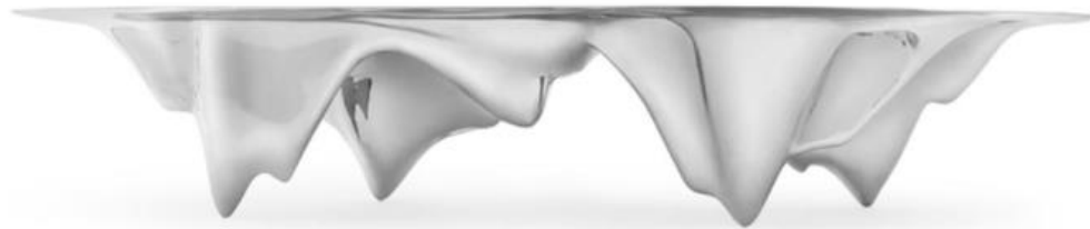
MAD Martian Dining Table by Ma Yansong, 2017