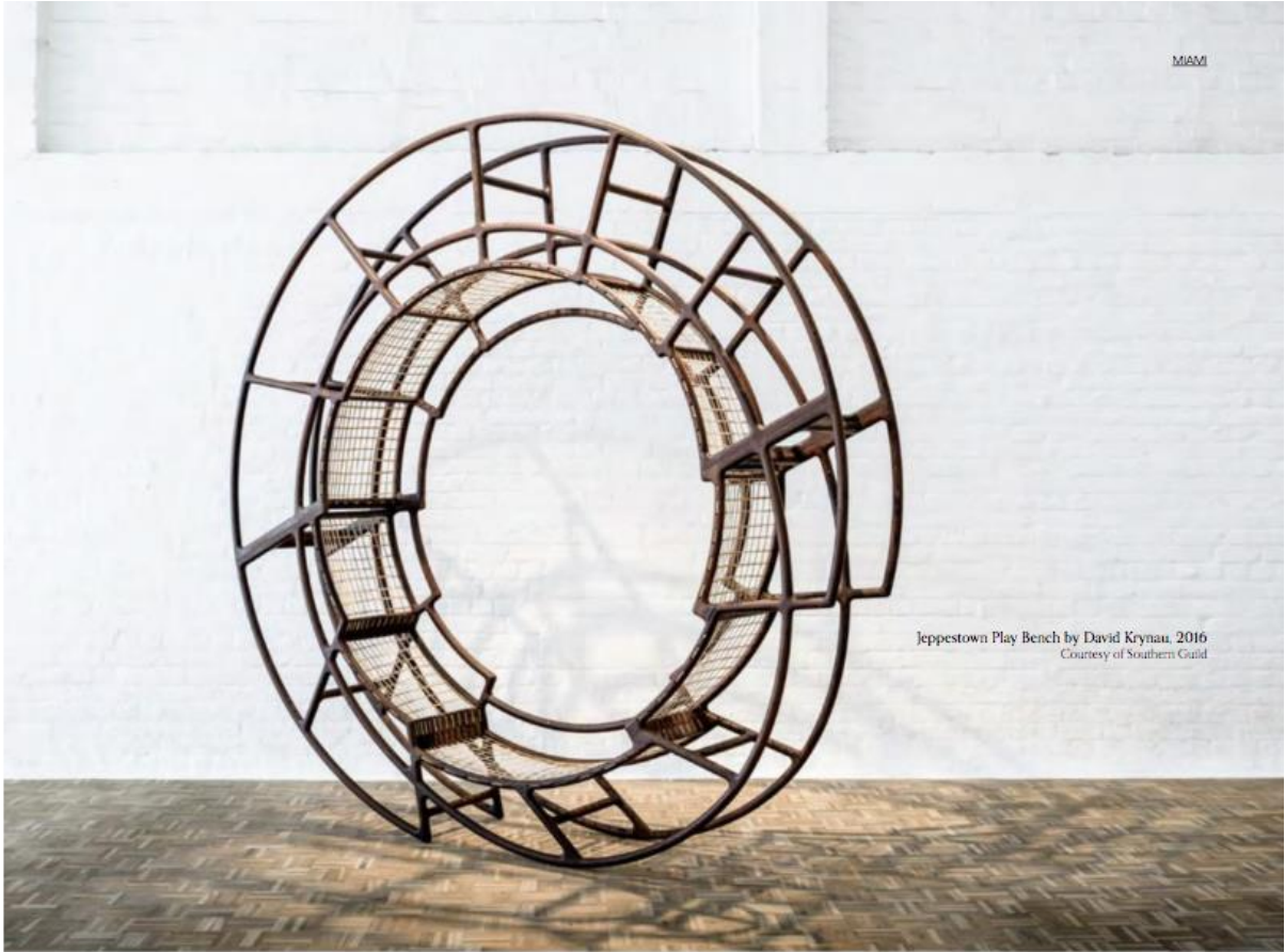
Jeppetown Play Bench by David Krynau, 2016